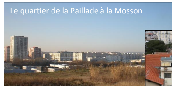
Le quartier de la Paillade à la Mosson