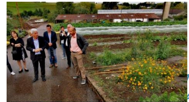
La régie maraîchère d'Épinal développée à Laufromont