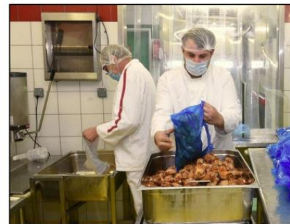
La cuisine centrale d'Épinal, déléguée à Elior